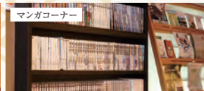
無料でご利用いただける約1,000冊のマングコーナー