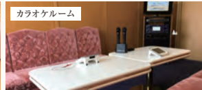
最新のカラオケ機器を完備。貸切でのご利用可能（有料）