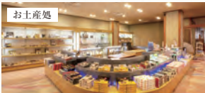
お菓子から九谷焼などのお土産品をご用意。