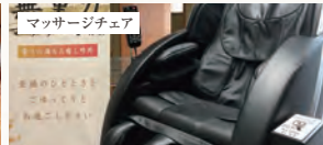
無重力マッサージ体験でリラックス（有料）