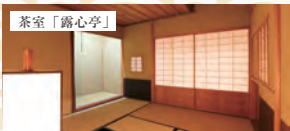
又隠様式を模した利便好みの四畳半茶室。