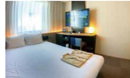
【スタンダードダブルルーム】