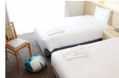
【ファイテールーム/ツイン】