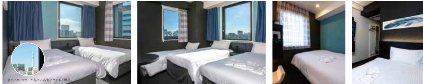
【LGスタイラールーム/ツイン】 【LGスタイラールーム/ツインエキストラ】 【スタンダードダブル】 【スタンダードシングル】