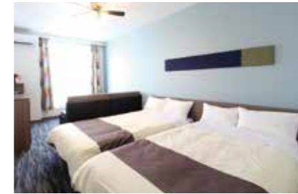
【スタンダードツイン】(4名様利用)