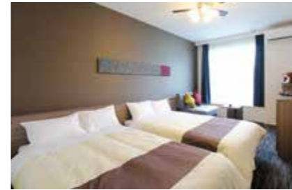
【スタンダードツイン】(2~3名様利用)