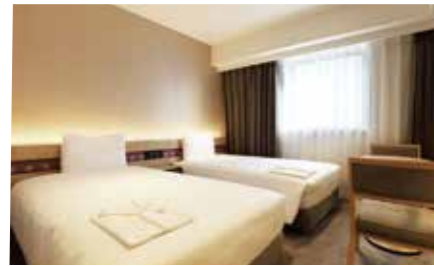
【スーペリアツインルーム】