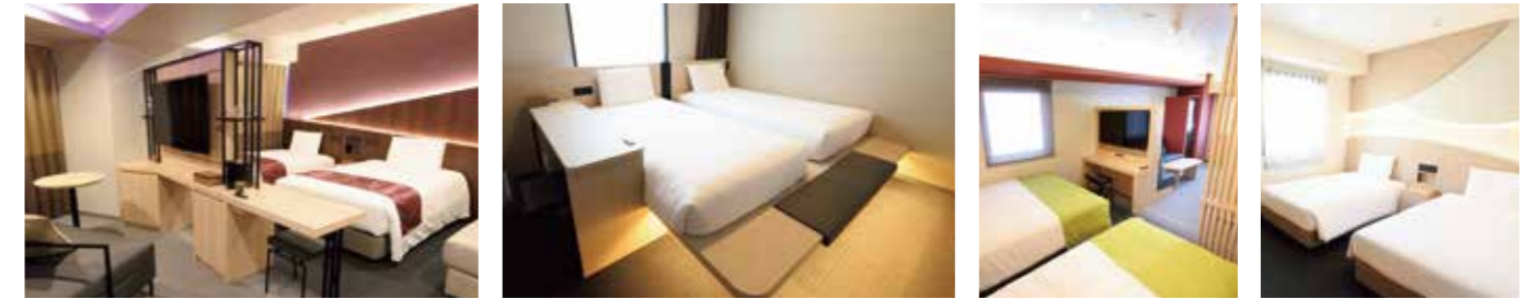
【コーナースイートルーム】 【ジャパネスクツインルーム(ハリウッドツインルーム)】 【ファミリースイートルーム】 【デラックスツインルーム】