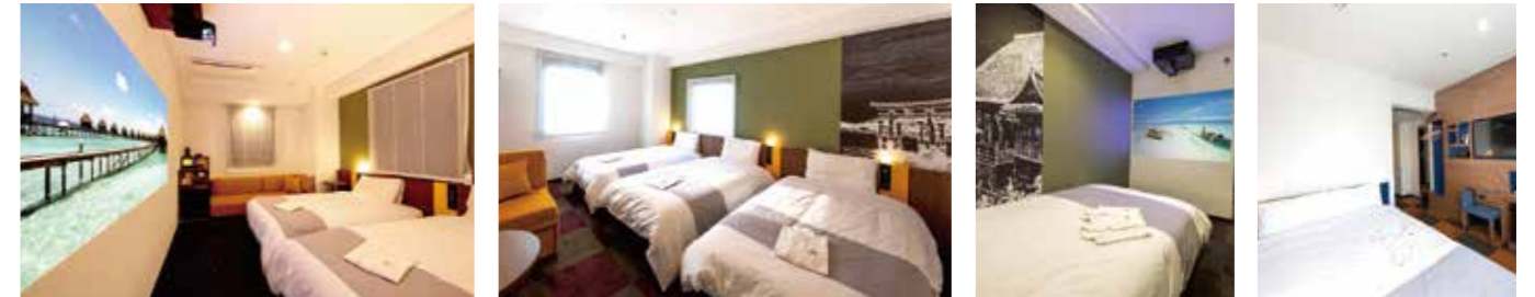
【シアタールーム/ツインエキストラ】 【LGスタイラールーム/トリプル】 【シアタールーム/セミダブル】 【LGスタイラールーム/ダブル】