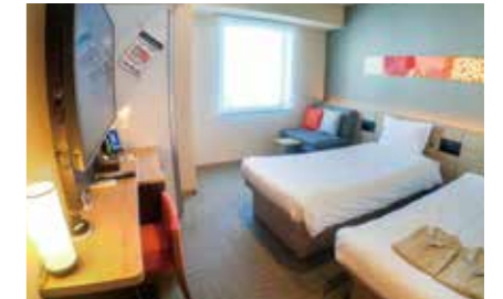
【デラックスツインルーム】