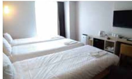
【スタンダードトリプル】