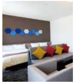
【デラックスツイン】