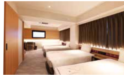
【フォースルーパー】