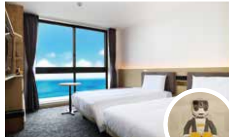
【ロボホンルーム/ツインバيفロント】