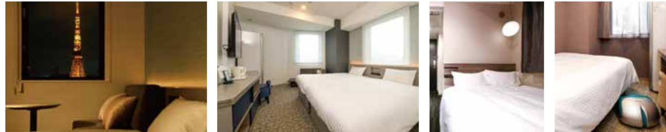
【タワービューデラックスツイン(高層階)】 【スタンダードツインルーム】 【スタンダードセミダブルルーム】 【ファイテン/シングル】