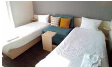
【スタンダードツイン】