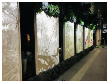
エントランス、フロント映像プロジェクション(イメージ)