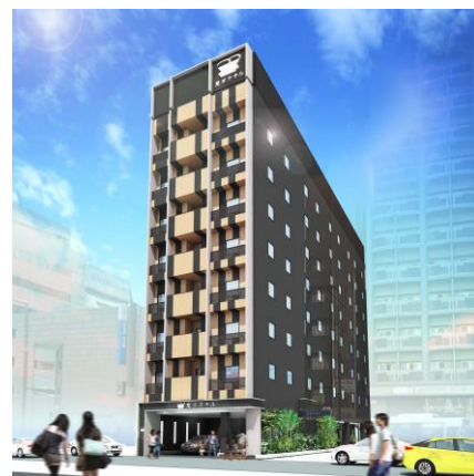
変なホテル福岡 博多（外観イメージ）

エントランスの壁一面から1階フロア全体を映像プロジェクションと恐竜ロボットによるエンタテインメント性の高い演出により、今までにない楽しい宿泊体験を提供いたします。