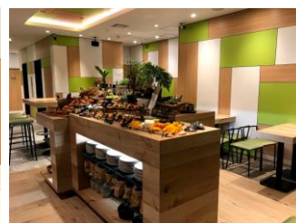
レストランは自然感を表したデザイン(イメージ)