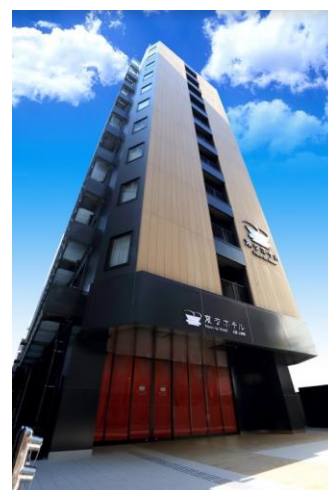
変なホテル大阪 心斎橋 外観(イメージ)

シャープ社によって開発されたロボホンズが19体でお出迎えいたします。多言語にてご挨拶や季節、時間合わせ様々なダンスを繰り広げます。