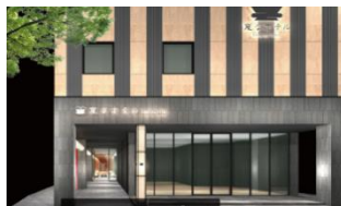
△エントランス（イメージ）

H.H.H.は、新型コロナウイルス感染症対策として、これまでのロボットによる非接触のフロント対応のみならず、すべての施設の館内や設備用品に関する通常より入念なアルコール消毒清掃の実施、手指消毒薬の設置、レストランにおけるバイキング形式から朝食セットメニューへの変更、ホテルスタッフのマスク着用、フロントチェックインカウンターでのソーシャルディスタンス確保など、ウィズコロナの対応を行っております。これからもお客様に安心してご利用いただけるホテルサービスを提供してまいります。