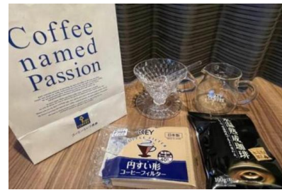
コーヒーセット/イメージ