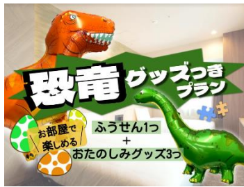
恐竜グッズ/イメージ