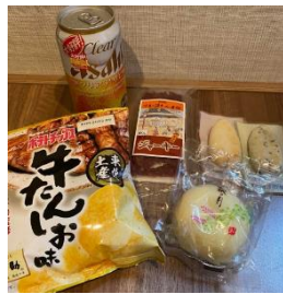
仙台お土産/イメージ