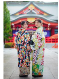
着物レンタル/イメージ

※最新価格は公式ホームページをご確認ください https://www.hennnahotel.com/sendai-kokubuncho/