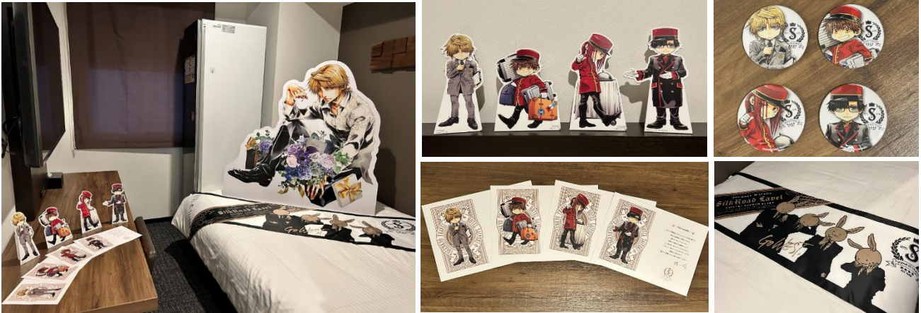
左：客室イメージ、中上：ミニスタンディパネルイメージ、中下：ウエルカムカードイメージ、右上：缶バッジイメージ、右下：ベッドスローイメージ

「変なホテル東京 銀座」では、人気漫画「最遊記」シリーズの連載 25 周年記念の原画展イベント「最遊記 25th EXHIBITION」とのコラボルーム“HOTEL SAIYUKI”を発売いたします。客室には、キャラクターの等身大パネル、ホテルスタッフに扮した SD キャラのミニスタンディパネルを設置、ベッドをオリジナルベッドスローで飾り、キャラクターからのウエルカムカードをご用意しております。SD キャラは峰倉かずや先生がコラボルームのために描き下ろしたイラストを使用しております。尚、ミニスタンディパネル、ベッドスロー、ウエルカムカードはお持ち帰りいただくことができ、さらにレターセット・缶バッジをプレゼントいたします。ホテル 1 階のマンガコーナーには「最遊記」シリーズを設置いたしますので、ご宿泊のお客様には客室にてご自由にお読みいただけます。宿泊プランは 2023 年 5 月 12 日（金）～6 月 4 日（日）の期間限定で、価格は「最遊記 25th EXHIBITION」の入場チケット付 36,800 円～、宿泊のみ 29,800 円～（いずれも 1 泊 1 部屋・朝食付/税サ込）、本日 20 時より予約受付を開始いたします。