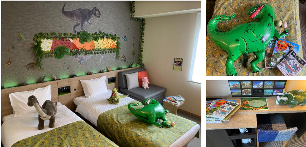
左：客室イメージ、右上：恐竜風船・バスボール・書籍イメージ、右下：デスクイメージ

「変なホテル東京 西葛西」のフロントでは、2体の恐竜ロボットがチェックインのお手伝いをしております。またホテル1階のレストランにて恐竜をテーマにした「恐竜朝食」をご用意しております。今回、お客様がお過ごしになる客室にも恐竜で装飾した“恐竜ルーム”をつくることで、チェックインからチェックアウトまでずっと恐竜とのふれあいをお楽しみいただき、ファミリーや恐竜好きのお客様の思い出に残るホテルステイをご提供いたします。