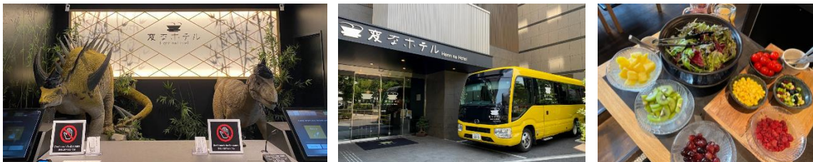
左：フロントイメージ、中：シャトルバスイメージ、右：恐竜朝食イメージ

H.I.S.ホテルホールディングス株式会社では、変なホテル・ウォーターマークホテル・リゾートホテル久米アイランド・ヴィゾン ホテルズ・満天ノ辻のや・グリーンワールドホテル・グアムリーフホテル・ホテルインスピラ-S タシケントの8ブランドにて、日本・ニューヨーク・ソウル・パリ島・台湾・グアム・タシケントの世界7都市6カ国に全43施設を展開しております。